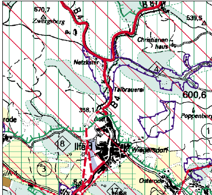
Auszug aus dem verbindlichen Regionalen Raumordnungsplan Nordthüringen (RROP-NT 1999)